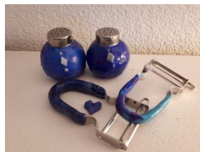
Verzierung mit Fimo