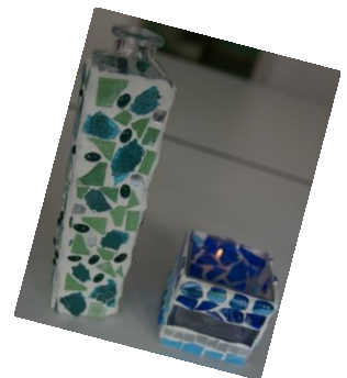
Mosaics for kids